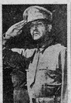
General MAC ARTHUR.